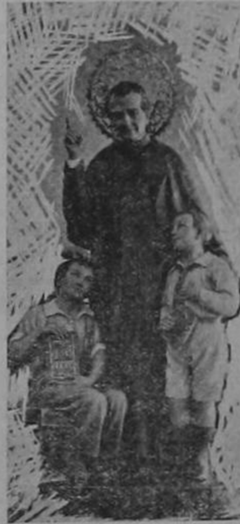
Preciosa imagen que se venera en el Oratorio Festivo de esta ciudad, obra del artista nacional don Manuel Zúñiga